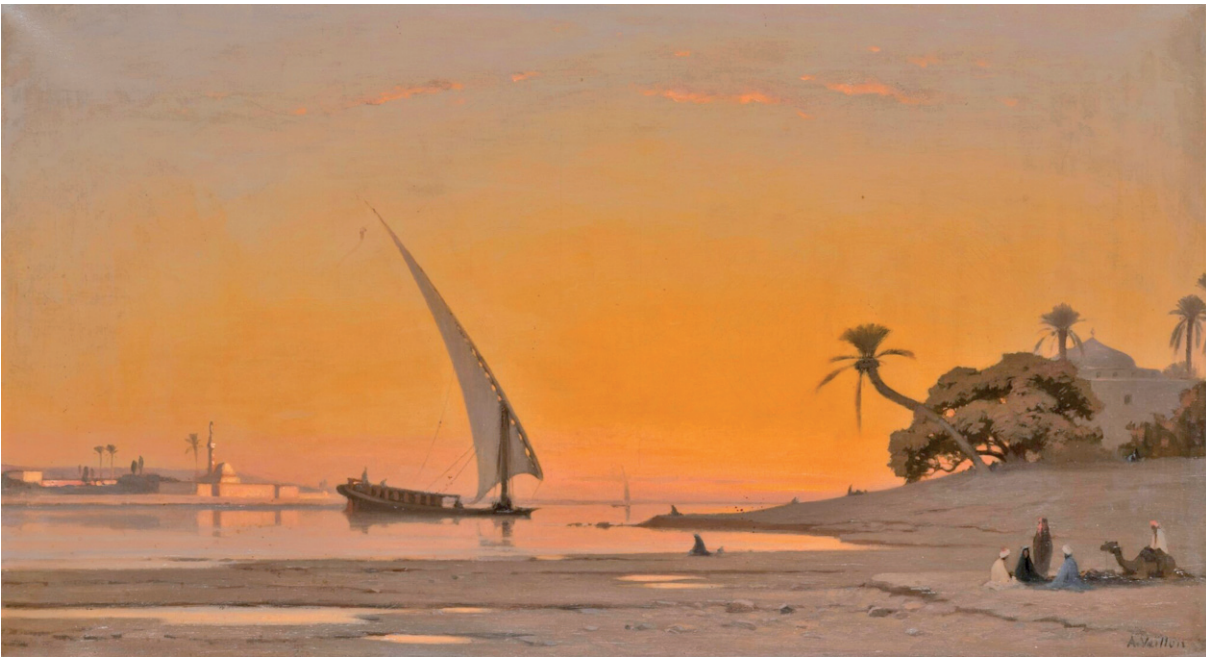
Felouque sur le Nil, Auguste Veillon

Freddy Gerber nous livre aujourd'hui l'histoire d'une forêt qu'il appréciait particulièrement en étant adolescent ! La forêt du Bochet sur la colline de Chiètres, en dessus de Bex, dont il a établi la généalogie « cadastrale ». Cette généalogie est directement liée à celle des VEILLON, dont le peintre Auguste VEILLON (1834-1890) est à l'honneur au Musée d'Art de Pully entre mars et juin 2023.