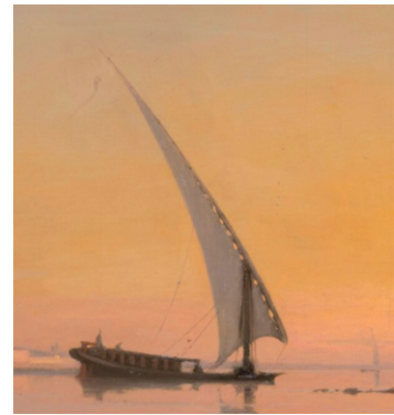
Détail d'un tableau du peintre Auguste Veillon