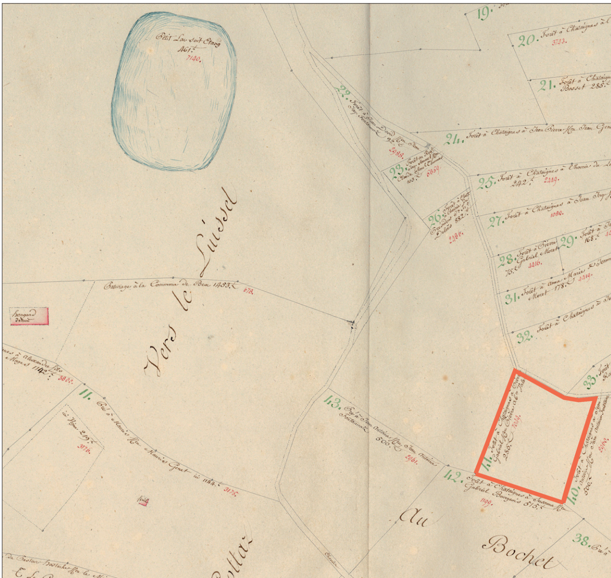
ACV Gb 2/h 1-3 Plans de Bex, 1808-1810 (en orange, la forêt du Bochet) et Gb 2/a/2 Plans d'une partie du terroir de la plaine de Bex, 1694-1710 (Une maison existe déjà au lieu-dit Es Besses)