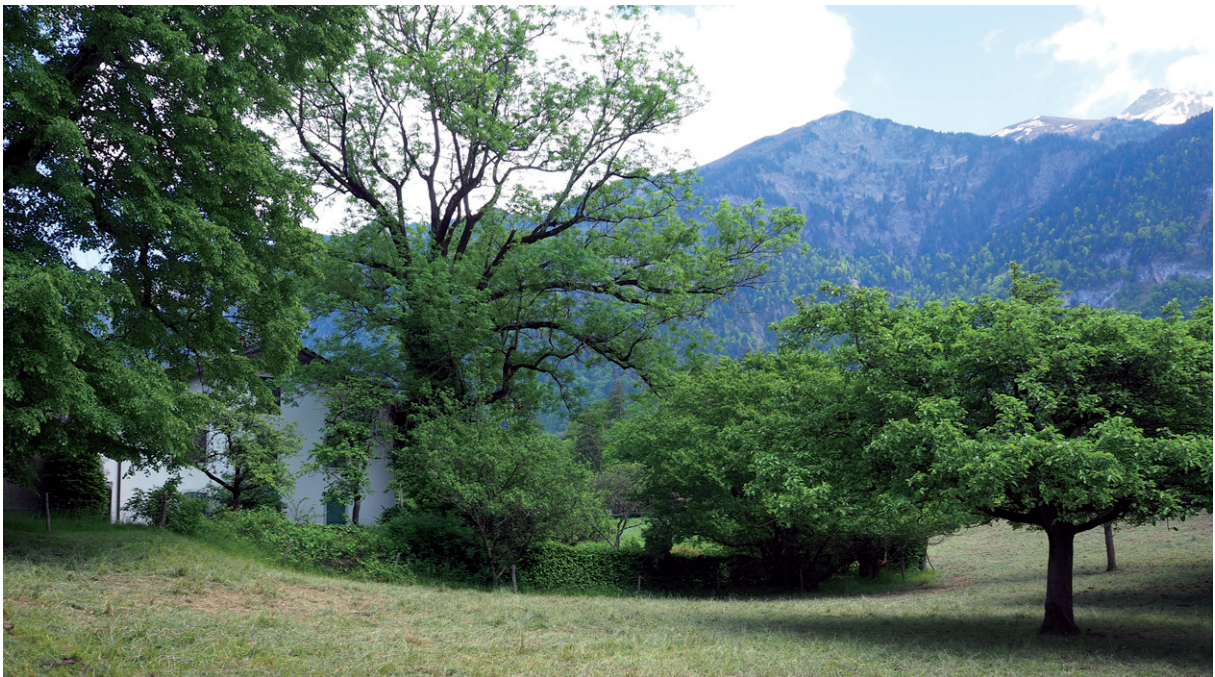
Le Domaine des Besses et la Croix de Javerne.