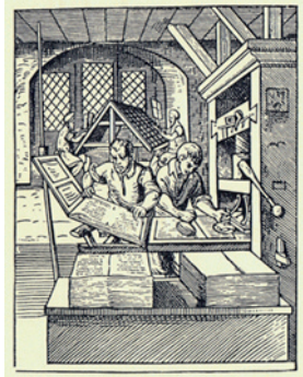
Atelier-musée Encre & Plomb

Regroupés au sein de l'Association Encre & Plomb, différents artisans et professionnels se sont donnés pour mission de perpétuer les métiers traditionnels de l'imprimerie. Et grâce à leur Atelier-musée il est possible de redécouvrir les différentes techniques d'impression utilisées durant les siècles passés. Entourés de milliers de casses de caractères, de trois presses à épreuve nommées Linotype, Intertype et Ludlow, d'une dizaine de presses à imprimer à pression, de machines à coudre, d'un massicot et d'une encolleuse de vignettes, ces passionnés du bel ouvrage se plaisent à transmettre leurs savoirs aux visiteurs tout au long d'un parcours didactique et ludique.