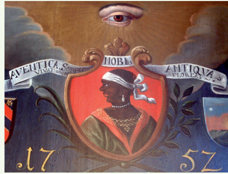
Avenches, détail d'un tableau de l'Hôtel de Ville

Sommaire Comité Agenda Nouveaux membres Sortie de printemps à Genève Rencontres Généalogiques des Pays de Savoie à Sevrier Sortie d'automne à Avenches Généalogie de la famille Meyer Trouvaille chez les botanistes Thomas