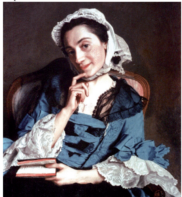
Mme d'Epainay par Jean-Etienne Liotard

Mais revenons à la recette de la religieuse vaudoise. Une piste intéressante pourrait être celle de la « tarte conversation », créée en 1774, dit-on, à l'occasion de la sortie du livre « Les conversations d'Emilie » de Mme d'Epainay. Cette pâtisserie se compose d'un fond en pâte feuilletée garni d'une pâte d'amandes, couronnée d'une glace royale. Les confiseurs Vernet auraient-ils eu l'idée de remplacer la couverture par un onctueux blanc d'oeuf battu en neige et délicatement meringué ? La question se pose.