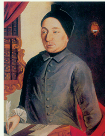
F.-B. De Felice A redécouvrir ce printemps

Avec ce dernier numéro de l'année 2012, le comité du Cercle vaudois de généalogie vous adresse ses vœux les meilleurs pour 2013.