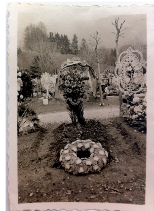
Quelques documents concernant la famille Tallichet