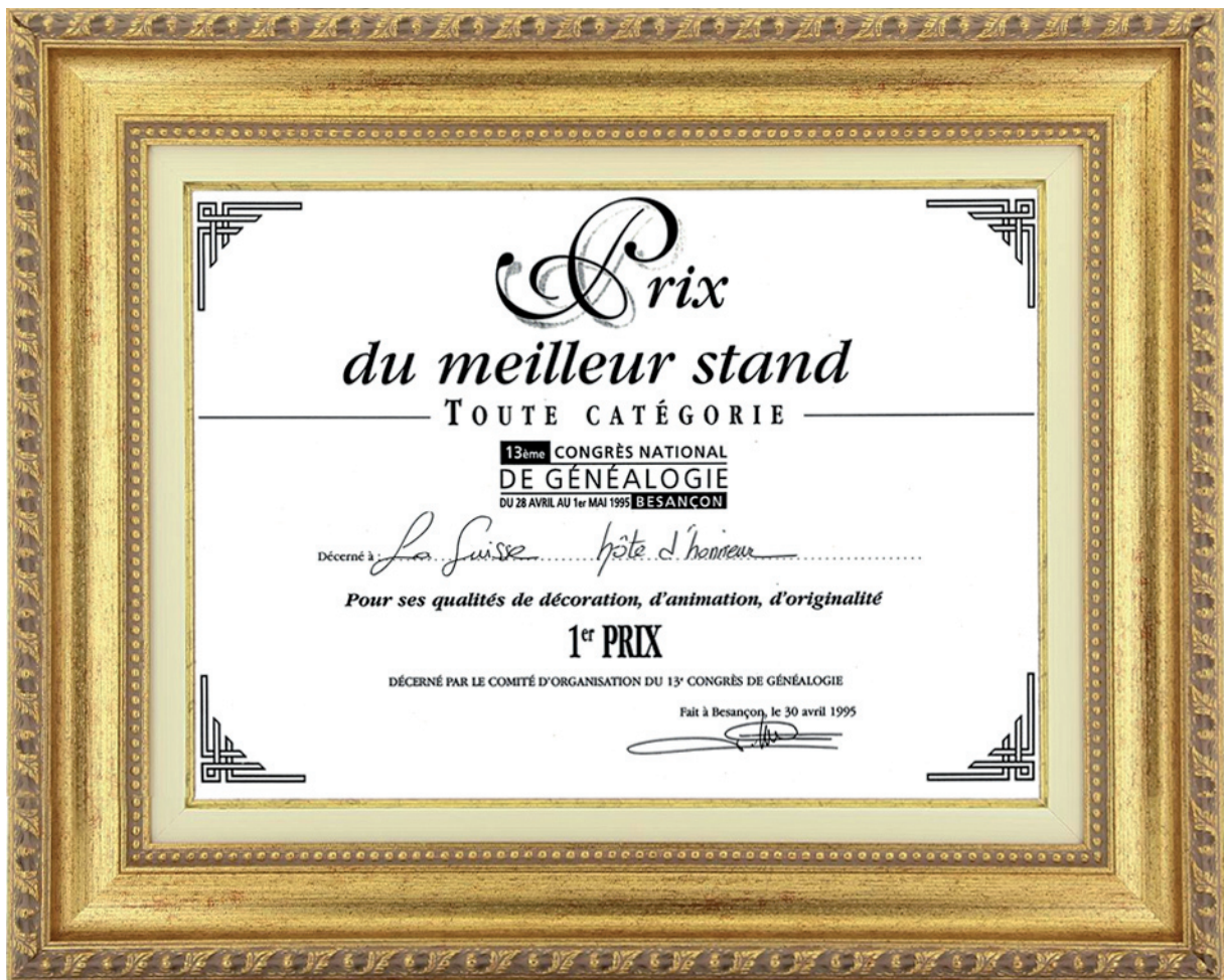
Le 1 er Prix décerné à la Suisse, hôte d'honneur du 13 e Congrès national de Généalogie à Besançon

Le prochain Congrès se tiendra du 2 au 4 octobre 2015 au Futuroscope de Poitiers.