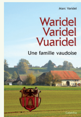
La publication de Marc Varidel

Généalogie des Varidel, Waridel et Vuaridel, par Marc Varidel